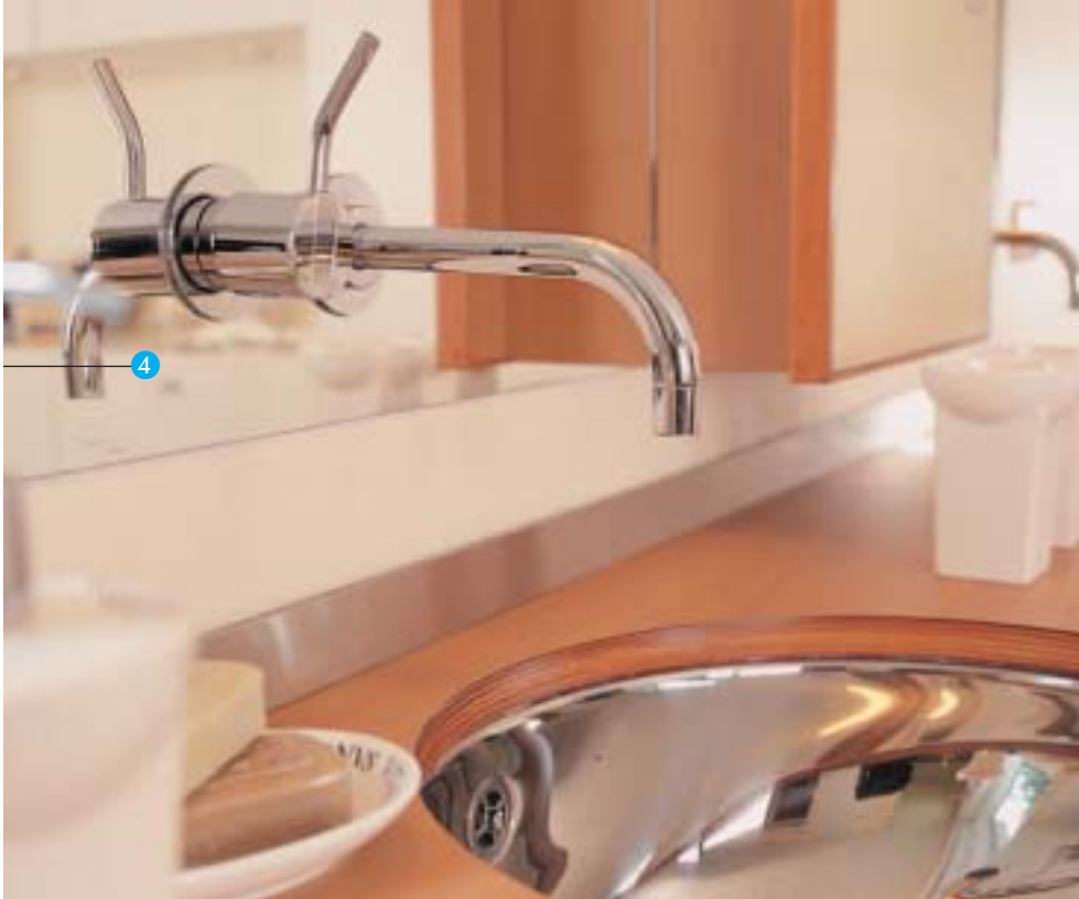
1 De whirlpool met een op maat gemaakte houten ombouw. 2 Op het wensenlijstje voor de badkamer stond onder andere een ruime douche, zonder douchebak of gordijn. 3 De zacht getinte badkamer krijgt kleur door een Grieks ogende fresco op de muur. 4 Het badkamermeubel loopt als dressoir door in de slaapkamer.

beide kanten langs kunt kijken blijft het gevoel van één grote ruimte intact. Opvallend is het sanarium, dat tussen douche en toilet is geplaatst. “We waren helemaal niet uit op een sanarium, maar ik las er een artikelje over in een van de vele badkamerbladen die ik op zoek naar douchesystemen doorbladerde. Marco en ik zijn gek op de sauna, de kinderen houden meer van stomen. Toen ik over het sanarium las, was ik direct enthousiast. Je kunt hem namelijk naar wens instellen op een droog saunaklimaat of een vochtig stoombadklimaat.”