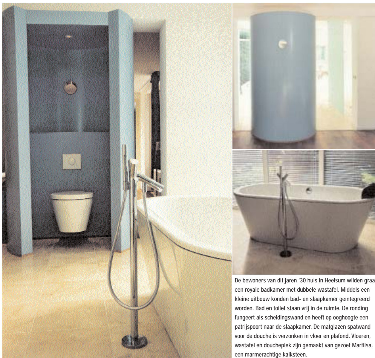
De bewoners van dit jaren '30 huis in Heesum wilden graag een royale badkamer met dubbele wastafel. Middels een kleine uitbouw konden bad- en slaapkamer geïntegreerd worden. Bad en toilet staan vrij in de ruimte. De ronding fungeert als scheidingswand en heeft op ooghoogte een patrijspoort naar de slaapkamer. De matglazen spatwand voor de douche is verzonken in vloer en plafond. Vloeren, wastafel en doucheplek zijn gemaakt van gezoet Marfilsa, een marmerechte kalksteen.